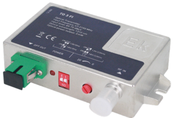
TO 3 FI