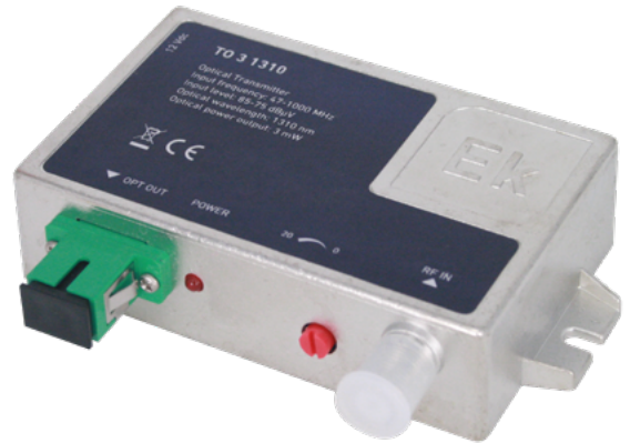
TO 3 1310