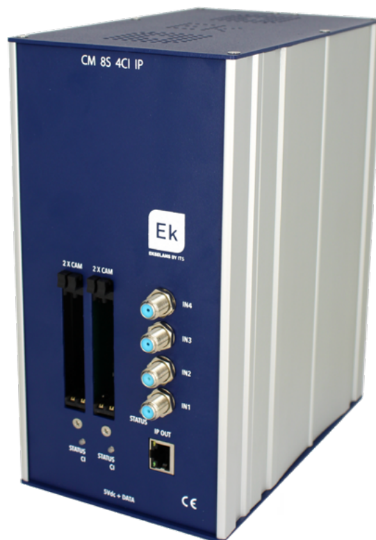
CM 8S 4CI-IP