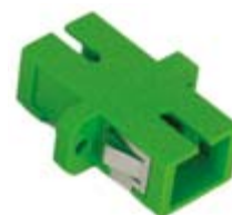
A SCAPC S