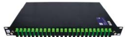
BF 48 C