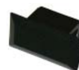
TP AD S