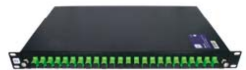
BF 24 C