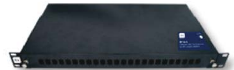
BF 24 S